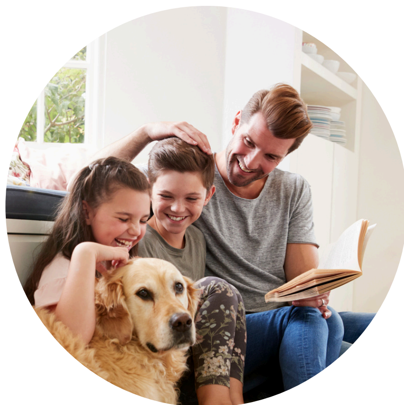
para sua família