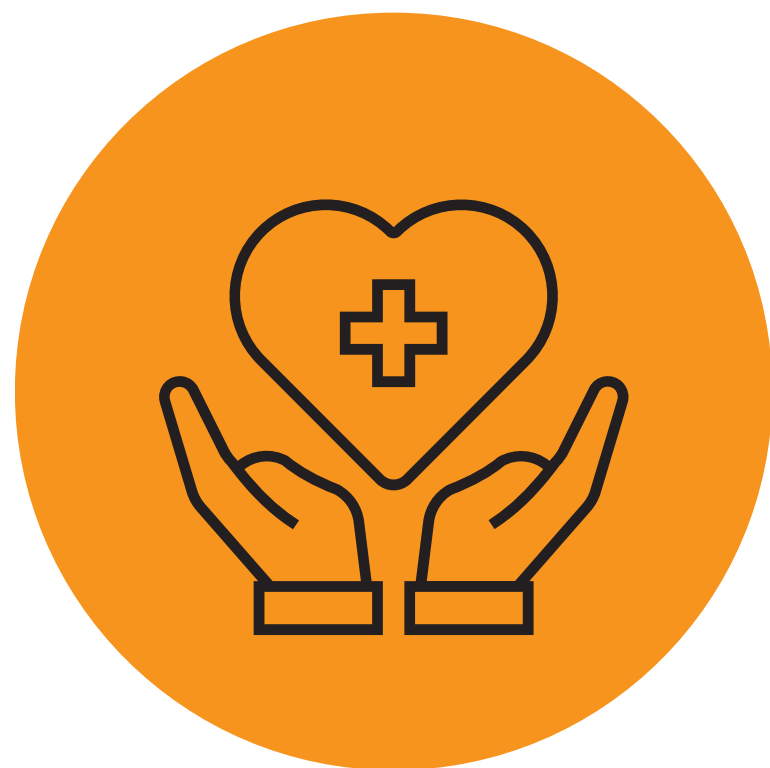
Planos de Saúde