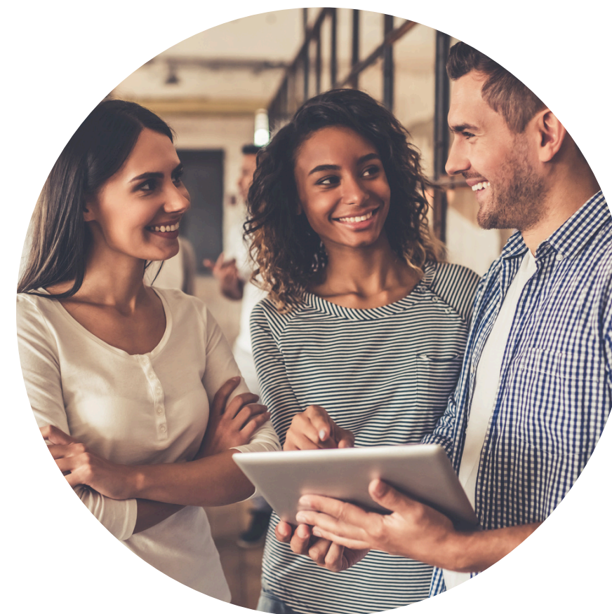
para sua empresa